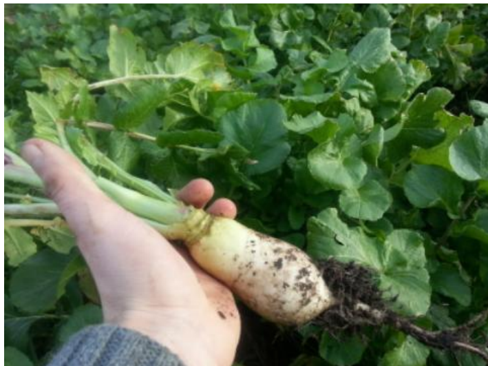
Eet gezonder, het dient jezelf, je portemonnee en de aarde.

Inmiddels rijzen er dicht bij huis steeds meer vragen over het verdwijnen van de natuurlijke leefomgeving en de wijze waarop de dieren gehouden worden.