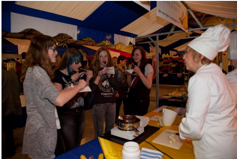
Leerlingen op het Dendron College in Horst kunnen alvast eens proeven hoe Fair Trade bananen in een Fair Trade chocolade jasje smaken. 11-04-2014.

Voor de zomervakantie nemen we Venlo deel aan: "Kantelen naar een energieke regio", Schouwburg Venlo . We wisselen informatie uit met de gemeente over Fair Trade.